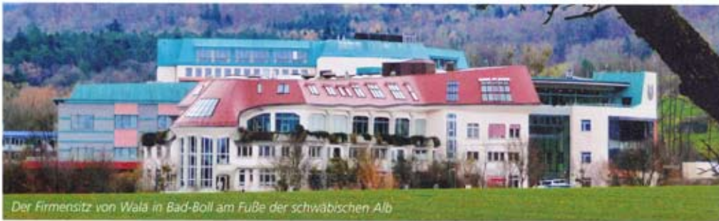
Der Firmensitz von Wala in Bad-Boll am Fuße der schwäbischen Alb

hält ein Stromanbieter aus Baden-Württemberg wiederholt den Zuschlag. Dieser erzeugt seine Energie ausschließlich mit Wasserkraft, wodurch Jahr für Jahr mehrere hundert Tonnen CO 2 -Ausstoß vermieden werden. Das ist nur eines von vielen Beispielen für den schonenden Umgang der Wala mit natürlichen Ressourcen.